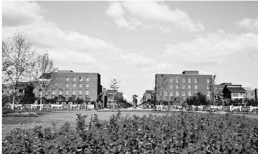
天津滨海——中关村科技园外景。

在此基础上,集团面向华际航空、无创智控、天津龙电等重点企业,提供政企对接、高校引才、资质申报、融资增信等“一企一策”定制化服务,助力企业在轨道交通、生物安全、生物科技、智慧电力等细分赛道持续突破,快速成长为京津冀协同创新中的硬核新锐力量。