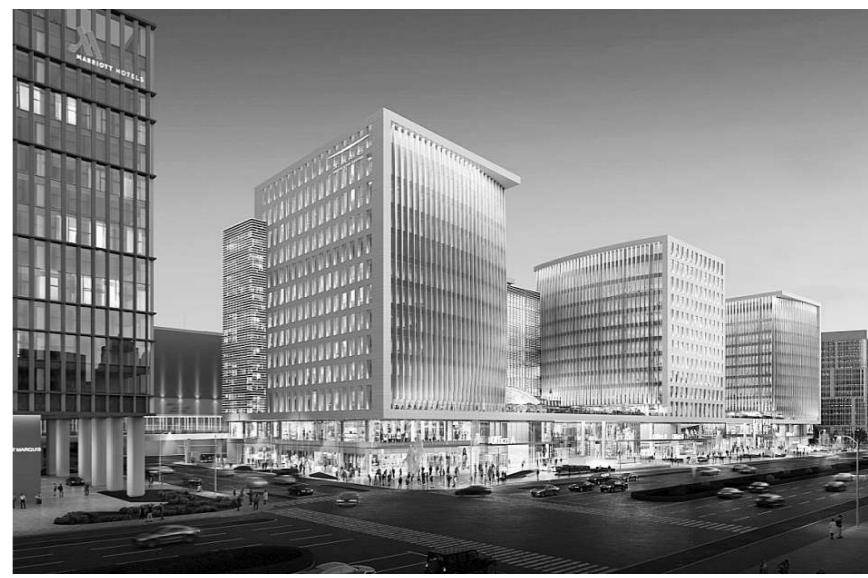
北辰中心外景效果图。