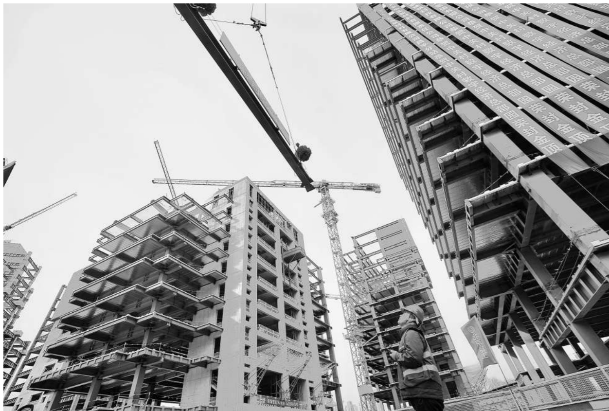
中关村数字经济总部园封顶现场。

按计划,机器人赋能的中关村数字经济总部园项目预计2027年5月完工,将与周边小米科技园、元中心形成强大产业集聚效应,打造集产业办公、街区商业、星级酒店、服务式公寓于一体的TOD创新产城融合生态。