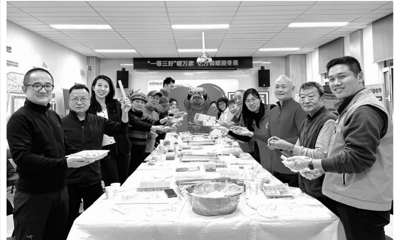
首开亿方物业第三分公司“一带三好‘暖万家 亿方情暖迎冬至’活动现场。