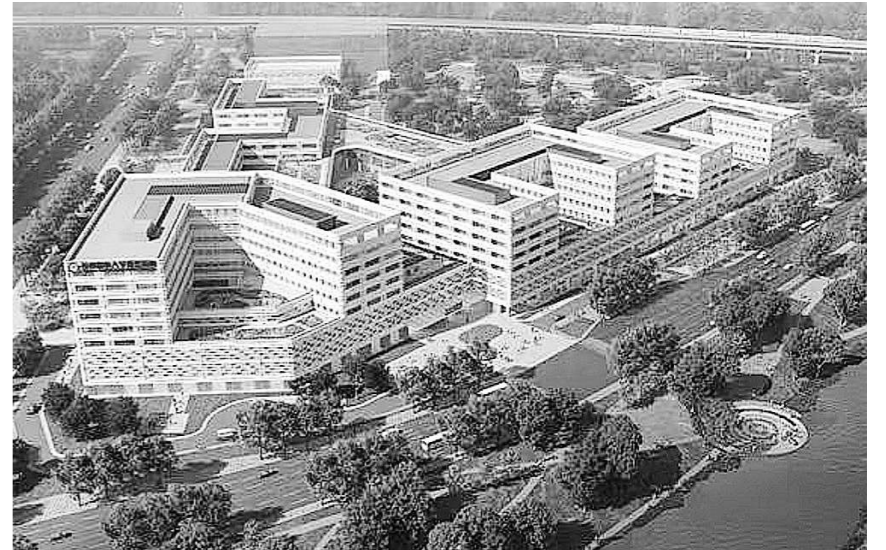
首都医科大学宣武医院房山院区效果图。

设计上,院区创新采用“神经元共生”建筑理念,南北两组主体建筑通过放射状交通体系相连,围绕中央大厅形成高效诊疗动线,实现临床、教学、科研、康复等功能区的无缝衔接。智慧医疗是项目亮点,将融合“互联网+医疗”模式,对接“掌上宣武医院”平台提供全流程便捷服务,搭建与西城院区同源的数字化诊疗平台,应用远程会诊等智慧技术。结合地铁区位优势,通过轨道交通一体化设计压缩患者就医时间,便利老年及行动不便的患者,打造集智慧、韧性、绿色于一体的“智慧健康生态综合体”。