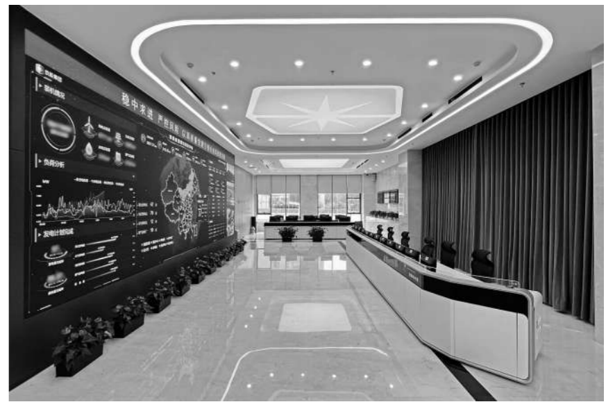
京能集团所属清洁能源智慧监管平台展示。

模式的迭代升级离不开体系支撑。在街道统筹下,首开亿方物业第三分公司牵头组建了“安华西里物业服务联盟”,联合8家物业及产权单位协同共治,破解了老旧混产小区管理碎片化的难题。公司也屡获“社区最佳物业”等荣誉,居民赠送的锦旗挂满了办公室墙面。首开亿方物业相关负责人表示,未来将继续深化2.0模式,按照“逐楼逐区、稳步推进”思路,从便利化、标准化、智能化、品质化四个维度发力,完善社区服务圈,让“一带三好”2.0模式的理念在更多社区生根开花,持续将服务成果转化为居民可感可及的幸福生活。