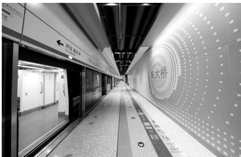
乘客乘坐17号线可在东大桥换乘6号线。

积累了宝贵经验。 科技赋能 智慧绿色亮点纷呈 17号线中段在多站实践“站城融合”理念,推动轨道交通与城市功能、公共空间深度融合。潘家园西站创新采用特殊工法,在极其狭小的施工场地内破解了建设难题。全线应用以行车指挥为核心的综合自动化系统,大幅提升了运营智能化和可靠性。 18号线作为北京轨道交通智慧工地示范线,在国内首次大规模应用柔性直流牵引供电技术,可高效回收利用列车制动产生的能量,相较于传统整流机组节能5%至10%。线路采用的车辆是国内最轻的6编组B型地铁列车,并首次批量应用碳纤维电加热