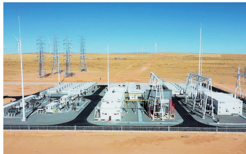
京能查干淖尔“风光储+氢”智慧一体化示范项目。

巴盟40万项目作为国家首批沙戈荒大型风电光伏项目,承载着推动能源转型与边疆生态治理的双重使命。项目总装机容量400兆瓦,安装78台风电机组,新建220千伏升压站及储能系统。运行时,自动装置与保护装置投入率与动作正确率均达100%,综合厂用电率低至1.21%,等效可利用小时高达2600小时,稳居国内同期同类型机组前列。该项目从建设之初便以高标准编制专项创优方案,并全过程严格执行,全力保障安全“零事故”。通过生活污水循环利用、超低温空气源热泵供热、全场LED节能照明等举措践行“四节一环保”,高分通过绿色施工专项评价。