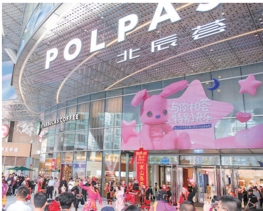
长沙北辰荟开幕现场。