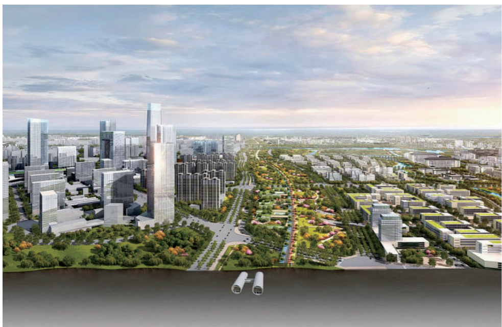
东六环改造工程项目(资料图)